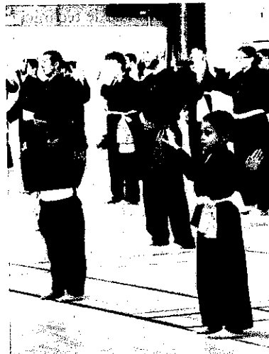
Petits et grands ont partagé l'espace, réunis par la même passion.

L'occasion de rappeler à chacun — et notamment aux instructeurs — les programmes de travail, ainsi que les consignes strictes relatives à la tradition du Thanh Long et des arts martiaux traditionnels vietnamiens. Citons la discipline, le